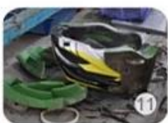
semi-finished In-mold helmet