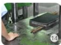
Inner padding production