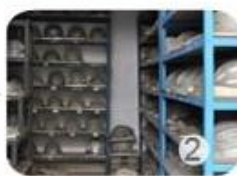
PC blister tooling