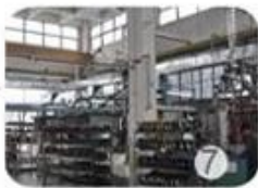
Helmet in-mold workshop