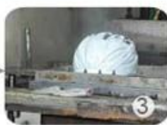
PC blister manufacture