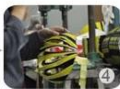
Trimming dug hole