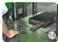
Inner padding production