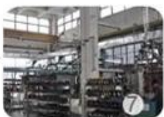
Helmet in-mold workshop