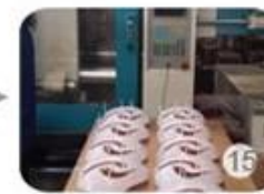
Plastic injection workshop