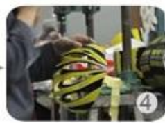
Trimming dug hole