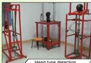
Head type detection