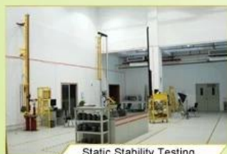
Static Stability Testing

Every manufacturing steps at AURORA follows adhere to strict quality parameters and focus on quality throughout the each stagesinvolved. All raw material and semi finished goods at AURORA pass strict quality control. The finished product, helmets at Aurora is then tested and qualified to export to the world.