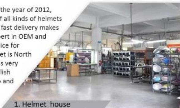
1. Helmet house

Shenzhen Aurora Sports Goods Co., LTD established in the year of 2012, more than 22 years experience. Expert in production of all kinds of helmets for different sports. Excellent quality, reasonable price, fast delivery makes us get very good reputation among our customers. Expert in OEM and ODM orders. Our skilled R&D team offers one stop service for throughout customers. 99% export and our main market is North America, European, Australia, Japan etc. Your enquiry is very welcomed and we will try our utmost to help you establish solid market. We are looking for long term relationship and get win win situation.