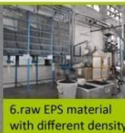
6. raw EPS material with different density