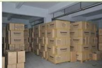
9. finished helmet

Willkommen allen unseren Kunden und Partnern.: / span & gt; Besuchen Sie uns unsere R & amp zu sehen; E-Zentrum und Fabrik.: / span & gt; Anlagen. In unserem Ausstellungsraum führen wir eine große Auswahl an Helmen für eine breite Palette.: / span & gt; von Sportanwendungen, die alle zu sehr attraktiven Design! Wenn Sie nicht finden, was Sie sind.: / span & gt; suchen, sagen Sie uns, unser freundliches und zuvorkommendes Personal für Sie gerne Ihre Helme Bedarf zu helfen.