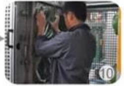
In-mold producing process