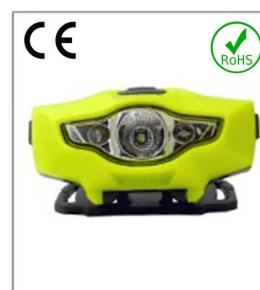
Versatile LED headlight 1A EN 55015: 2006