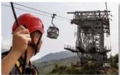
Cable car maintenance