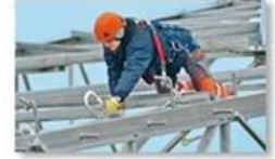
Work at height