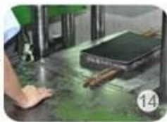
Inner padding production