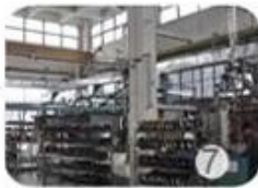
Helmet in-mold workshop