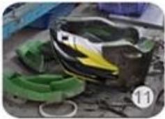
semi-finished In-mold helmet