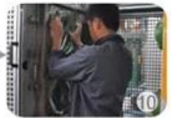
In-mold producing process