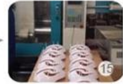
Plastic injection workshop