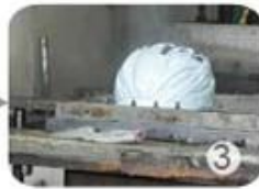
PC blister manufacture