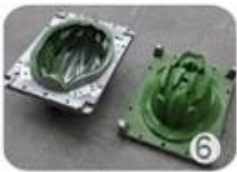
EPS in-mold tooling