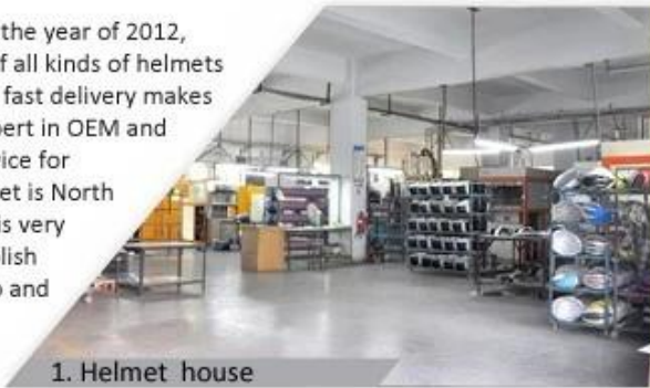
1. Helmet house

Shenzhen Aurora Sports Goods Co., LTD established in the year of 2012, more than 22 years experience. Expert in production of all kinds of helmets for different sports. Excellent quality, reasonable price, fast delivery makes us get very good reputation among our customers. Expert in OEM and ODM orders. Our skilled R&D team offers one stop service for throughout customers. 99% export and our main market is North America, European, Australia, Japan etc. Your enquiry is very welcomed and we will try our utmost to help you establish solid market. We are looking for long term relationship and get win win situation.