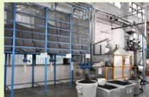
6. raw EPS material