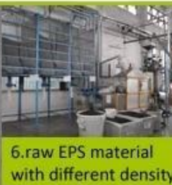
6. raw EPS material with different density