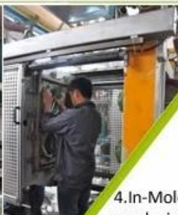
4. In-Mold producing process