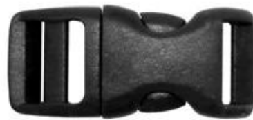
Traditional helmet buckle