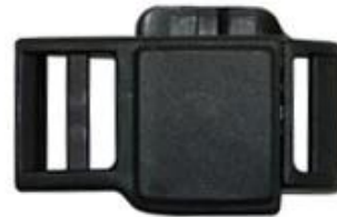
Fidlock magnetic buckle

We can also customize various colors buckle.