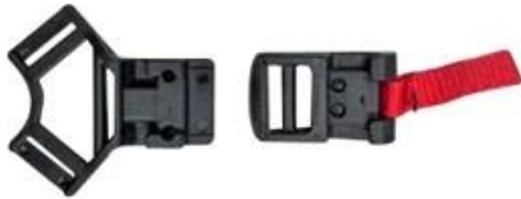
Patent self-developed magnetic buckle