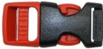
ITW standard helmet buckle