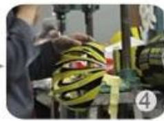
Trimming dug hole