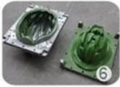
EPS in-mold tooling