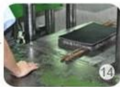
Inner padding production