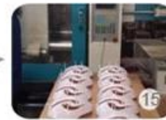
Plastic injection workshop