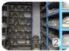
PC blister tooling