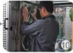
In-mold producing process