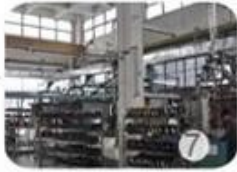
Helmet in-mold workshop