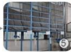
Eps raw material by different density