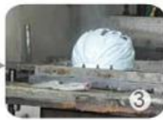
PC blister manufacture