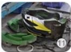
semi-finished In-mold helmet