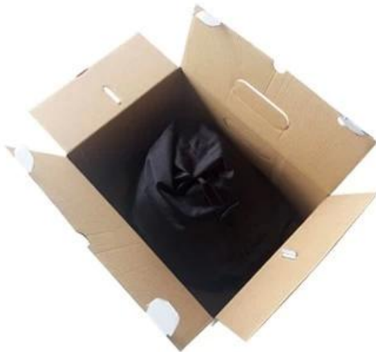
Cloth bag + Box Packaging White Box size: 31*23*18cm