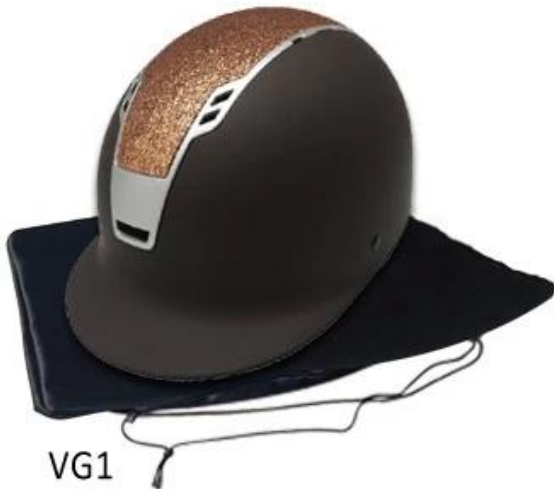
VG1 CE EN 1384 : 2017 Certificate