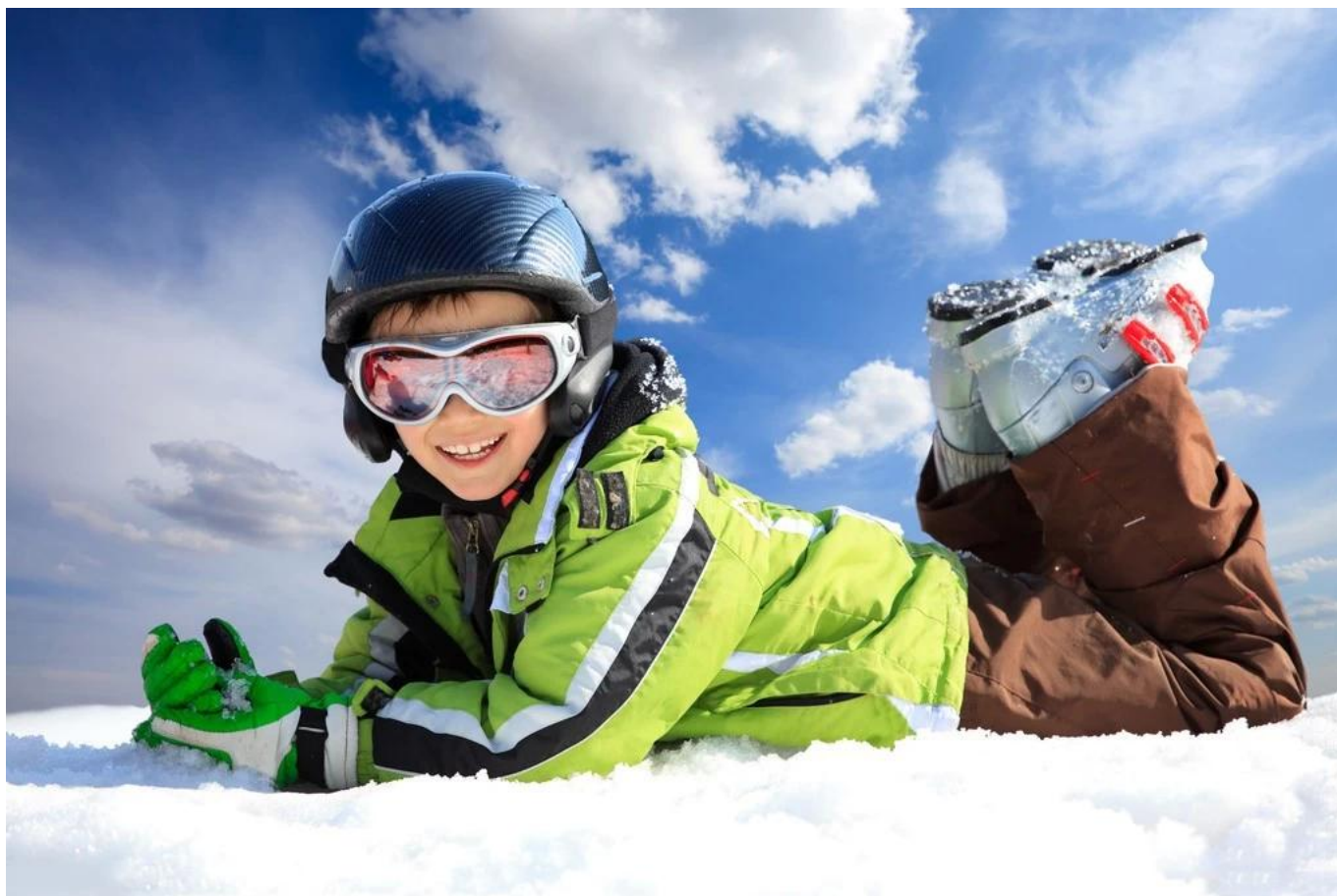
Demostración del cuadro