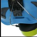
PLUG AND SOUNDPROOF EARMUFFS