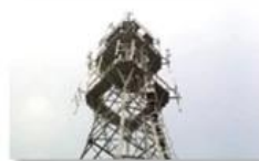
Mobile plant maintenance