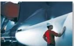
Pulp & paper