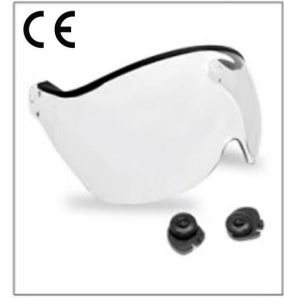
New deve loped clear visor EN266