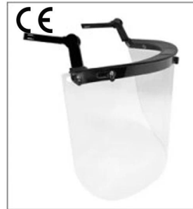
EN 166 ANSI Z87.1