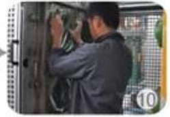
In-mold producing process