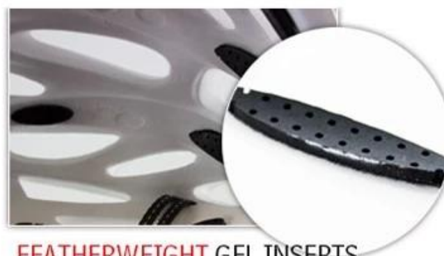
FEATHERWEIGHT GEL INSERTS