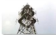
Mobile plant maintenance