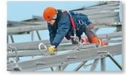
Work at height