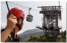
Cable car maintenance