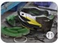
semi-finished In-mold helmet