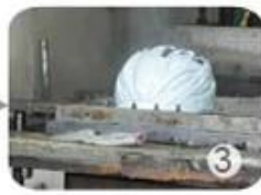
PC blister manufacture