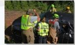
Rescue and evacuation