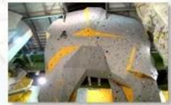
Big wall climbing