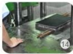
Inner padding production