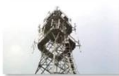
Mobile plant maintenance