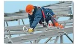
Work at height