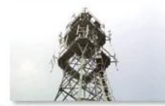
Mobile plant maintenance