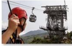
Cable car maintenance