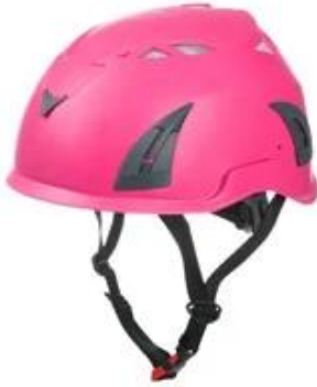
Pink pantone 806