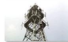
Mobile plant maintenance