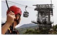
Cable car maintenance