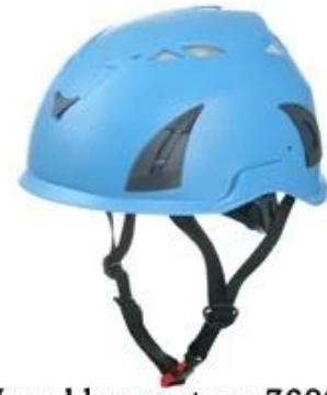
Navy blue pantone 7689 C