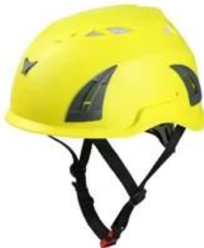
Yellow pantone 3965 U