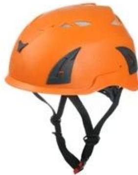
Orange pantone 165 C