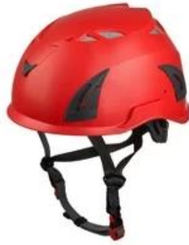
Red pantone 185 C