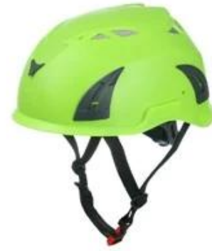
Lime green pantone 375 C