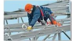
Work at height