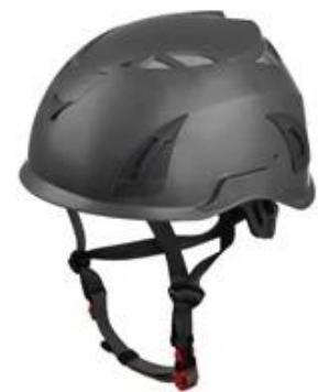
Grey pantone 432 C