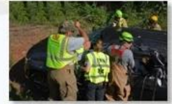
Rescue and evacuation