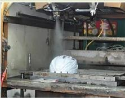
3. PC blister tooling