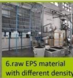
6. raw EPS material with different density