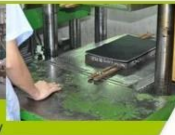
7. Inner padding Production