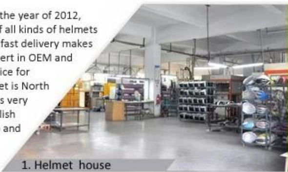
1. Helmet house

Shenzhen Aurora Sports Goods Co., LTD established in the year of 2012, more than 22 years experience. Expert in production of all kinds of helmets for different sports. Excellent quality, reasonable price, fast delivery makes us get very good reputation among our customers. Expert in OEM and ODM orders. Our skilled R&D team offers one stop service for throughout customers. 99% export and our main market is North America, European, Australia, Japan etc. Your enquiry is very welcomed and we will try our utmost to help you establish solid market. We are looking for long term relationship and get win win situation.