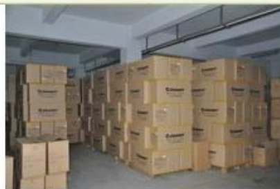
9. finished helmet