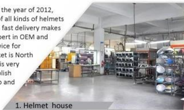
1. Helmet house

Shenzhen Aurora Sports Goods Co., LTD established in the year of 2012, more than 22 years experience. Expert in production of all kinds of helmets for different sports. Excellent quality, reasonable price, fast delivery makes us get very good reputation among our customers. Expert in OEM and ODM orders. Our skilled R&D team offers one stop service for throughout customers. 99% export and our main market is North America, European, Australia, Japan etc. Your enquiry is very welcomed and we will try our utmost to help you establish solid market. We are looking for long term relationship and get win win situation.