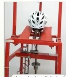
dynamic strength test