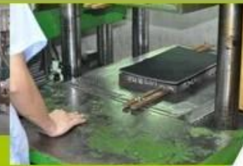
7. Inner padding Production