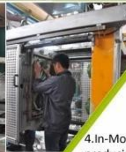
4. In-Mold producing process