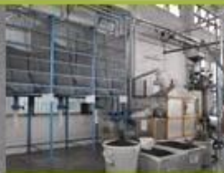
6. raw EPS material with different density