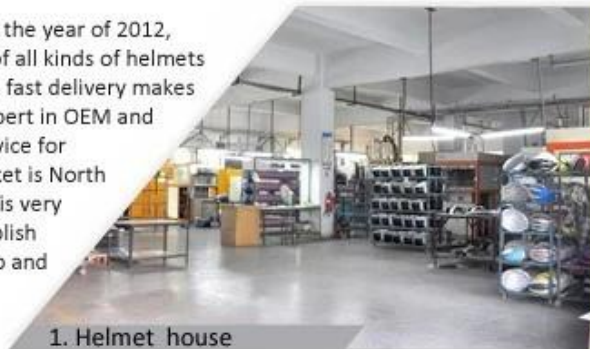
1. Helmet house

Shenzhen Aurora Sports Goods Co., LTD established in the year of 2012, more than 22 years experience. Expert in production of all kinds of helmets for different sports. Excellent quality, reasonable price, fast delivery makes us get very good reputation among our customers. Expert in OEM and ODM orders. Our skilled R&D team offers one stop service for throughout customers. 99% export and our main market is North America, European, Australia, Japan etc. Your enquiry is very welcomed and we will try our utmost to help you establish solid market. We are looking for long term relationship and get win win situation.