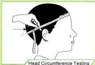
Head Circumference Testing