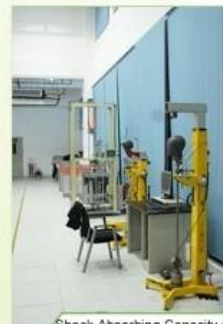
Shock Absorbing Capacity