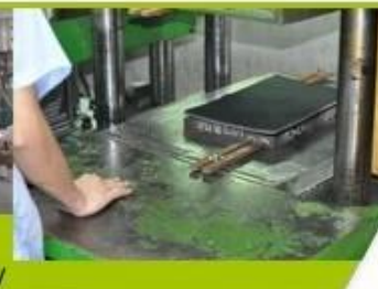
7. Inner padding Production