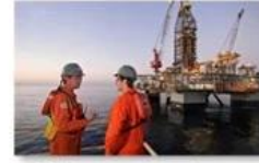
Offshore oil and gas