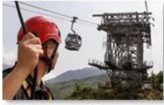
Cable car maintenance