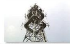
Mobile plant maintenance