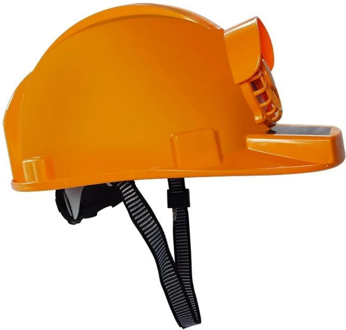
Grande ventiladorenfriamiento sistema