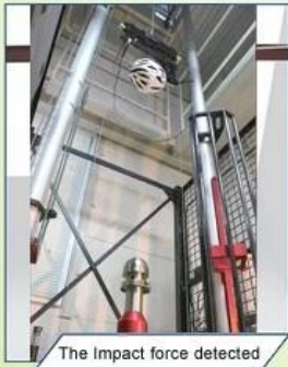
The Impact force detected