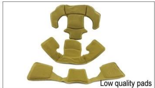
Low quality pads

Transpirabilidad y comodidad son muy importantes, por eso el Manta presenta correas Airlite que son un 15% más ligera que una correa del casco estándar. Tetonon correas son más ligeros, más fuertes y más transpirable que una correa del casco normal. Asimismo, no se adhieren a la cara con tanta facilidad cuando las temperaturas comienzan a aumentar. Fast correas Sistema de Adaptación puede ser fácilmente y de forma continua adaptada a su forma de la cabeza exacta. El casco se mantiene firmemente en la cabeza en todas las situaciones y las cinchas están siempre en la mejor posición.