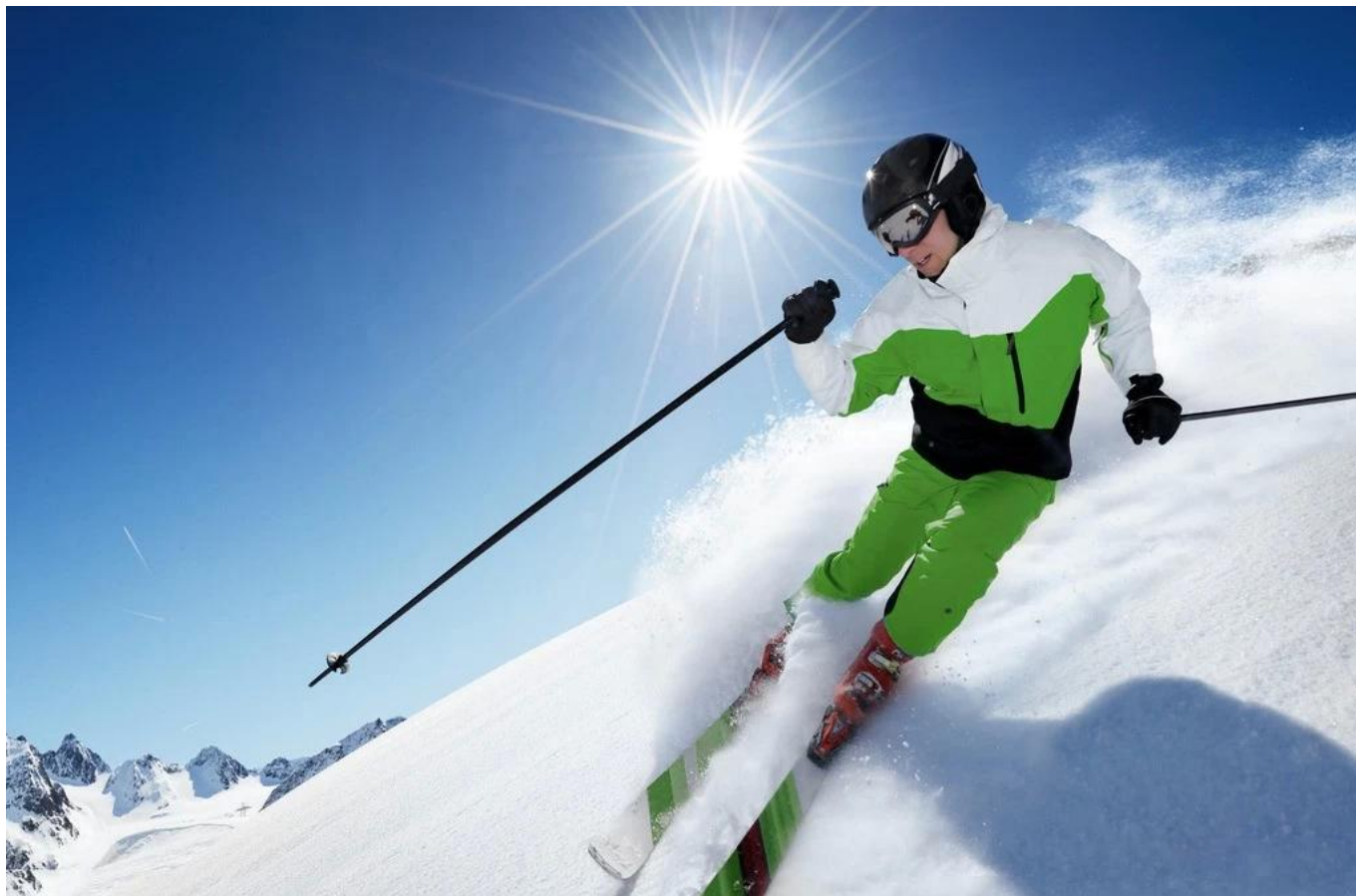
Demostración del cuadro