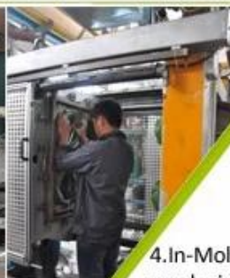
4. In-Mold producing process