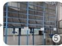
Eps raw material by different density