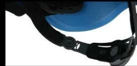
The adjustor arm can be adjustable -- DOWN