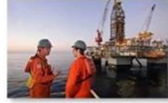
Offshore oil and gas