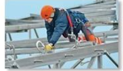
Work at height