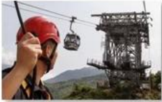
Cable car maintenance