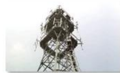
Mobile plant maintenance