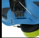
PLUG AND SOUNDPROOF EARMUFFS