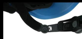
The adjustor arm can be adjustable -- UP