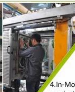
4. In-Mold producing process