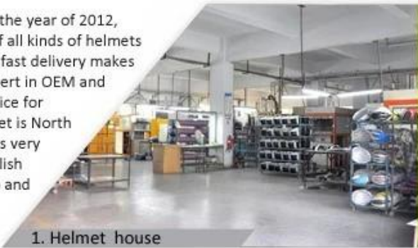
1. Helmet house

Shenzhen Aurora Sports Goods Co., LTD established in the year of 2012, more than 22 years experience. Expert in production of all kinds of helmets for different sports. Excellent quality, reasonable price, fast delivery makes us get very good reputation among our customers. Expert in OEM and ODM orders. Our skilled R&D team offers one stop service for throughout customers. 99% export and our main market is North America, European, Australia, Japan etc. Your enquiry is very welcomed and we will try our utmost to help you establish solid market. We are looking for long term relationship and get win win situation.