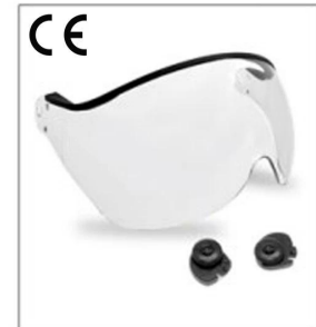
New deve loped clear visor EN266