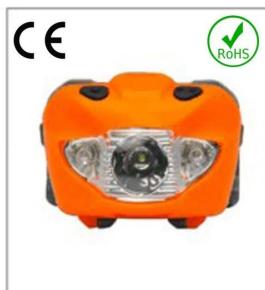
Versatile LED headlight 3A EN 61547:2009