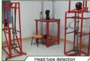
Head type detection