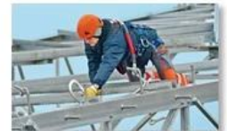
Work at height