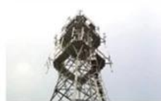
Mobile plant maintenance