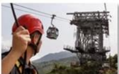
Cable car maintenance