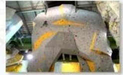
Big wall climbing