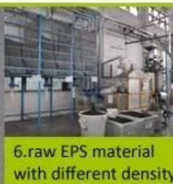
6. raw EPS material with different density