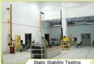
Static Stability Testing

Every manufacturing steps at AURORA follows adhere to strict quality parameters and focus on quality throughout the each stagesinvolved. All raw material and semi finished goods at AURORA pass strict quality control. The finished product, helmets at Aurora is then tested and qualified to export to the world.