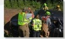
Rescue and evacuation