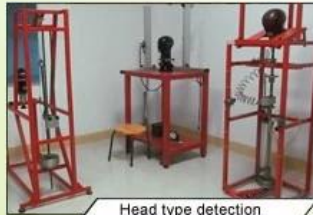
Head type detection