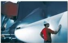
Pulp & paper