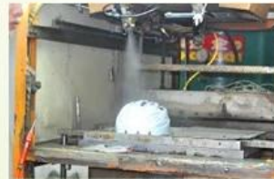
3. PC blister tooling