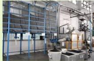
6. raw EPS material