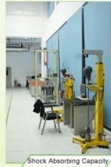
Shock Absorbing Capacity